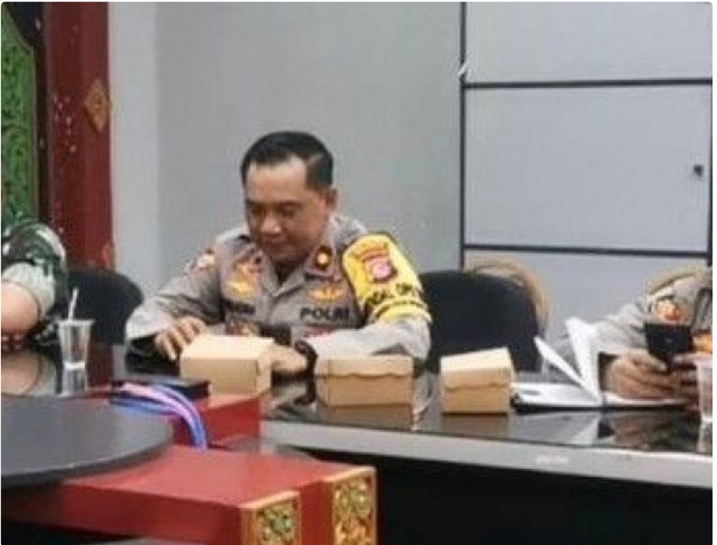
Kabagops Polresta Mataram saat menghadiri Rakor di Kantor Bupati Lombok Barat, Selasa (10/12/2024)

MATARAM, NTB – Dua tradisi budaya ikonik, Pujawali dan Perang Ketupat, akan kembali digelar di Pura Lingsar, Kecamatan Lingsar, Kabupaten Lombok Barat. Persiapan event tahunan ini kian dimatangkan oleh Pemerintah Kabupaten